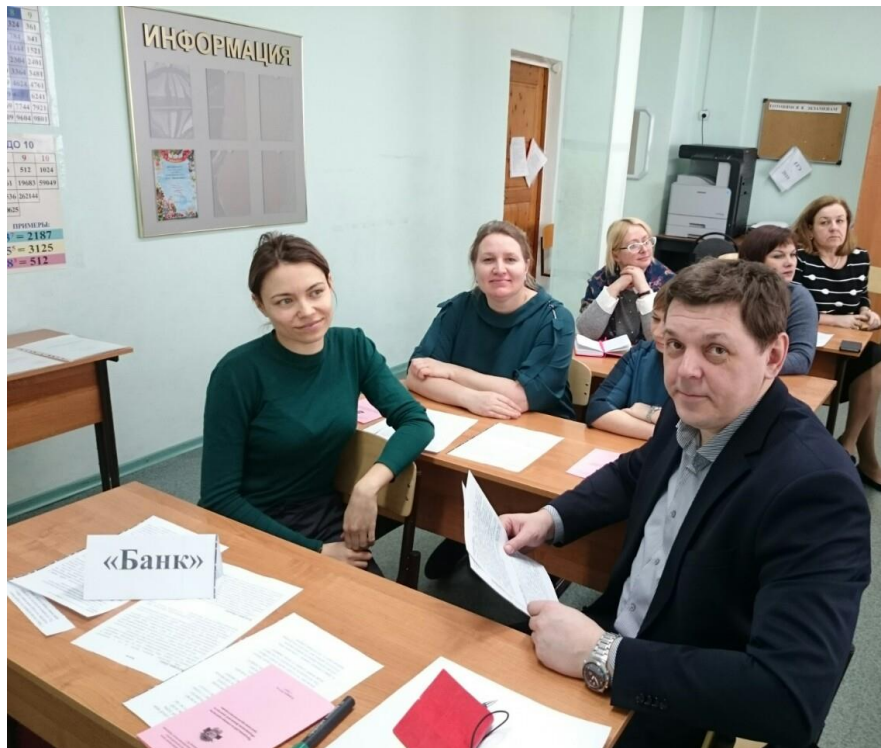
Учителя математики принимают участие в решении практических задач в области финансовой грамотности.