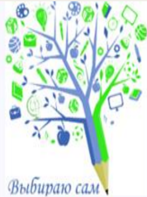
«Я - архитектор будущего»