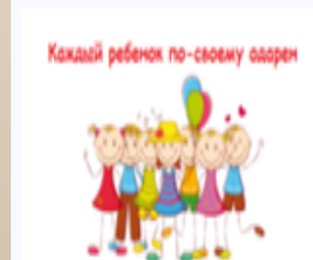
«Талантливые дети Сургута»