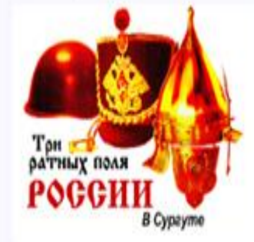
Официальный сайт культурно-образовательного проекта «Три ратных поля России в Сургуте»