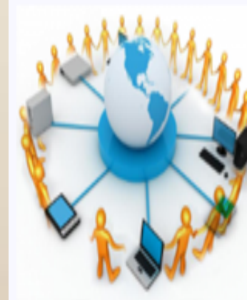
«Сетевое взаимодействие в муниципальной системе образования г. Сургута в условиях цифровой трансформации образования»