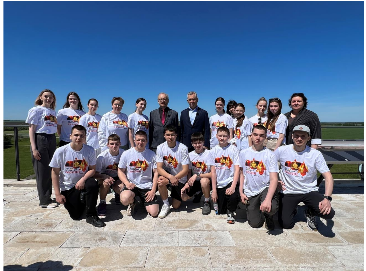
Культурно-образовательная поездка «Три ратных поля»