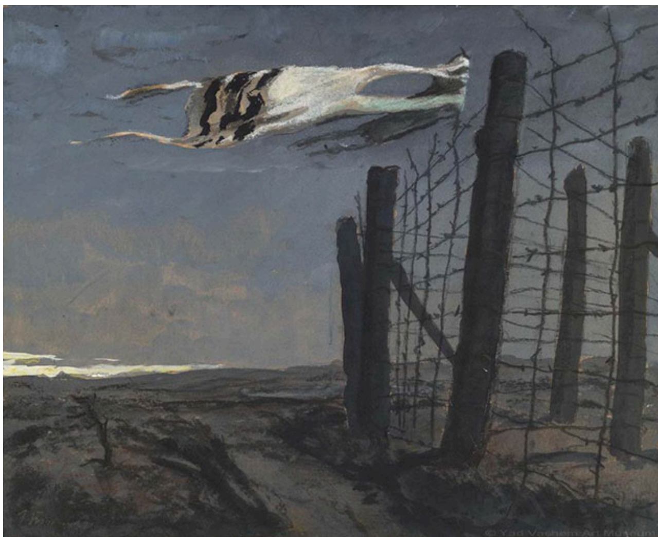
Зиновий Толкачев. «Талескотен», 1944 г.